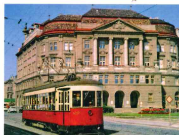
Reise durch die Zeit Brünnerstrasse