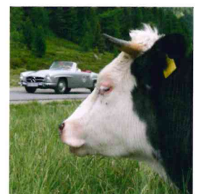
Veranstaltungen Saalbach Classic