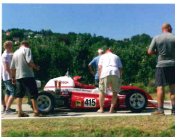
Bergrennrevival Bad Mühlacken